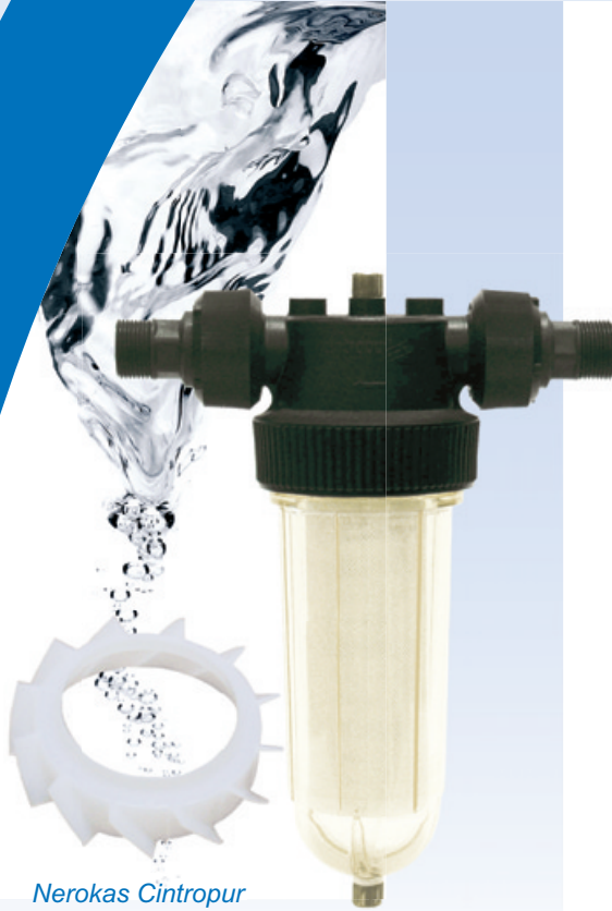
Nerokas Cintropur siipipyörä muuttaa veden virtauksen linkoavaksi.